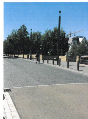
Beispiel Aufpflasterung und Mastleuchten