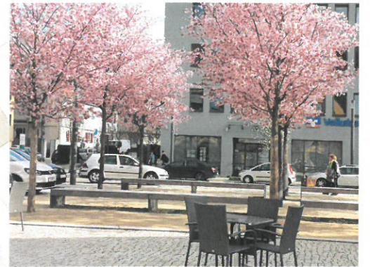
Beispiel Baumquartier mit Zierkirschen