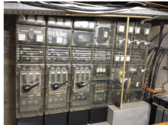
Elektroverteilung (Bauj. 1974)