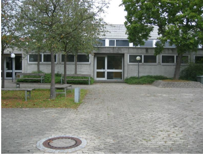
Betonfassade (ohne Dämmung)