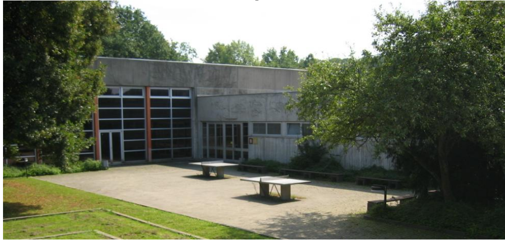
Betonfassade ohne Dämmung