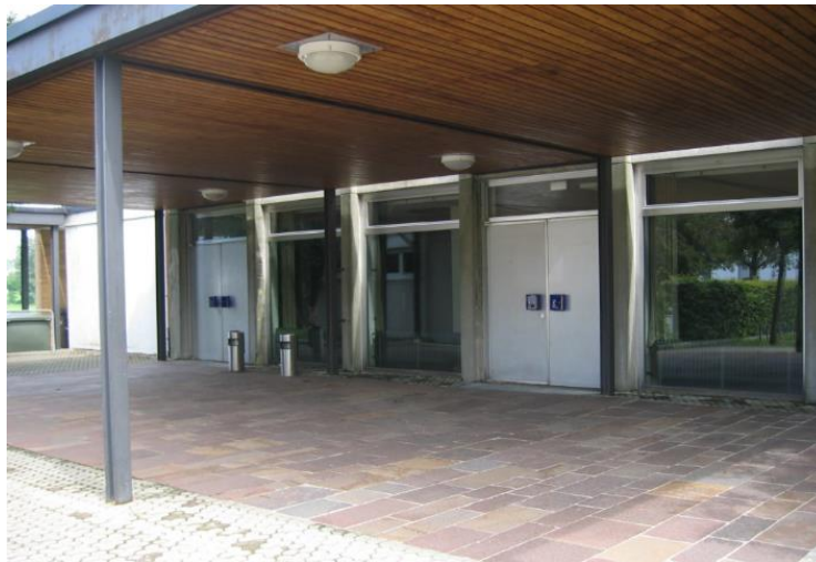
Betonfassade (nicht energetisch saniert)