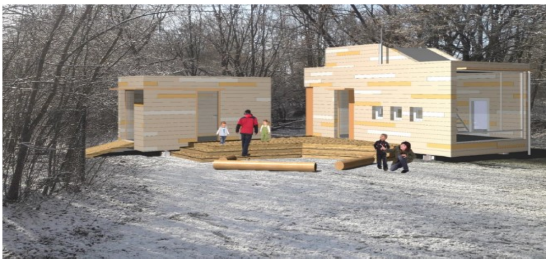
Abbildung: Animation der Architekten + Ingenieure Klaiber + Oettle

Die Kosten für die Errichtung der Schutzhütten belaufen sich auf rd. 675.000 €. Hinzu kommen noch rd. 25.000 € für die Erstausrüstung. Die Gesamtkosten von rd. 700.000 € sollen mit 70 % (also 490.000 €) gemäß Betreibervertrag bezuschusst werden.