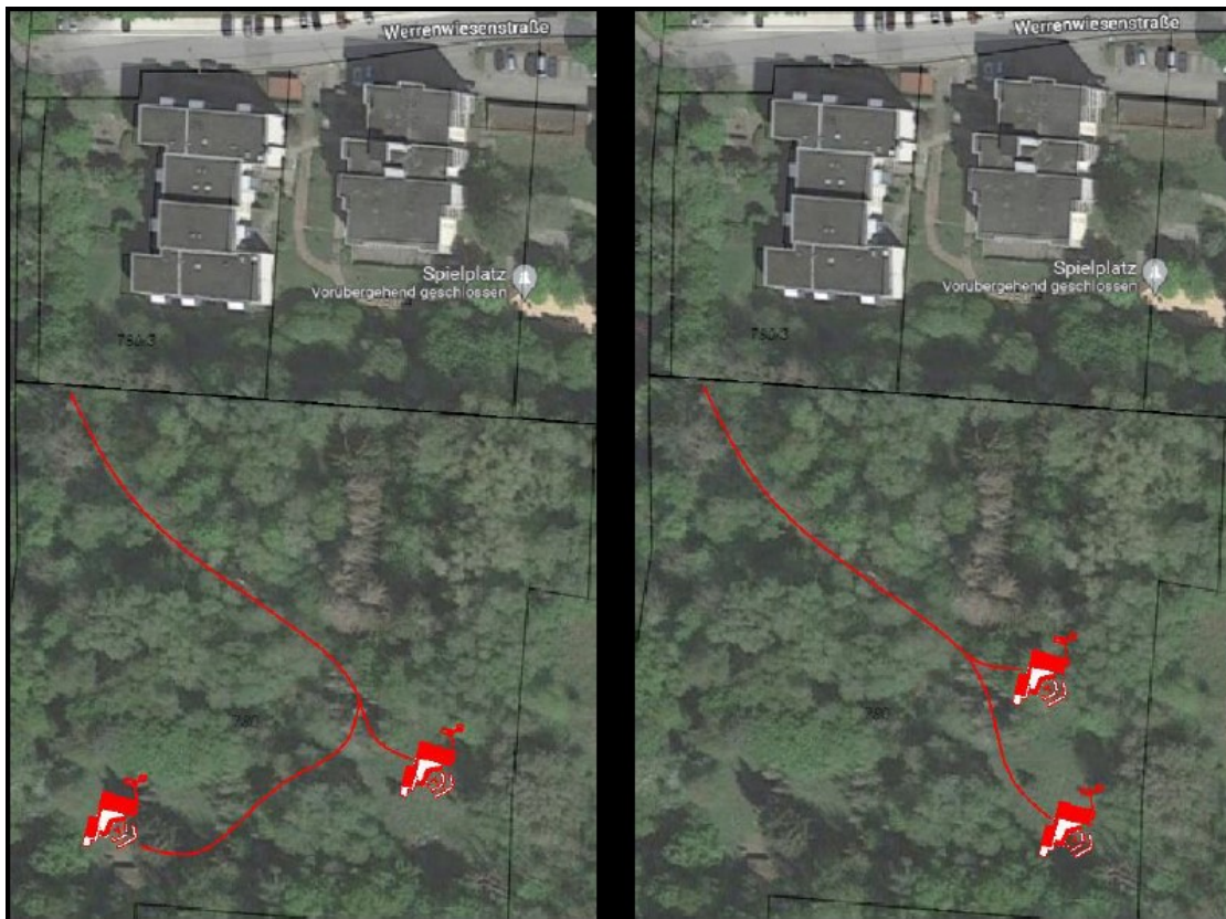
Abbildung: Mögliche Varianten für den Standort der beiden Naturgruppen

Die Kosten für die Errichtung der Schutzhütten belaufen sich auf rd. 675.000 €. Hinzu kommen noch rd. 25.000 € für die Erstausrüstung. Die Gesamtkosten von rd. 700.000 € sollen mit 70 % (also 490.000 €) gemäß Betreibervertrag bezuschusst werden.