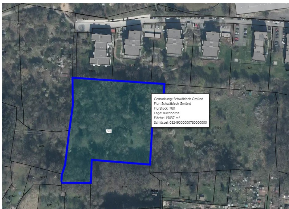
Abbildung: Auszug aus dem Geodatenportal der Stadt Schwäbisch Gmünd

Die Waldnaturgruppen befinden sich in der Oststadt von Gmünd. Für den Betrieb der Waldnaturgruppen ist die Errichtung jeweils einer Schutzhütte erforderlich. Um den Ausbau der Betreuungsangebote für Kinder in Schwäbisch Gmünd weiter voranzutreiben, wird die Maßnahme seitens der Stadtverwaltung als notwendig eingestuft.