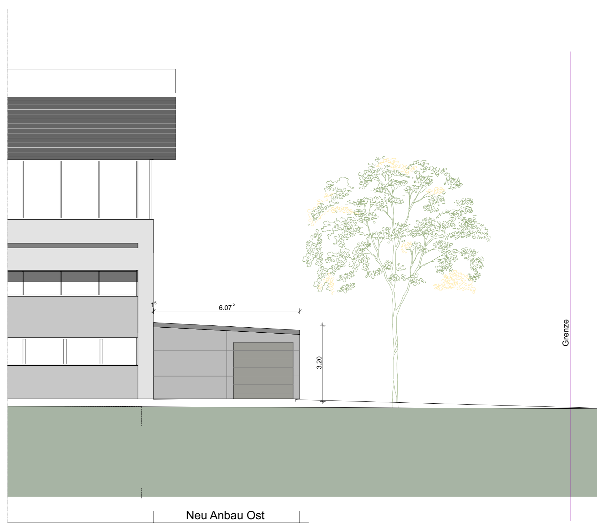
M 1-100 Ansicht Süd