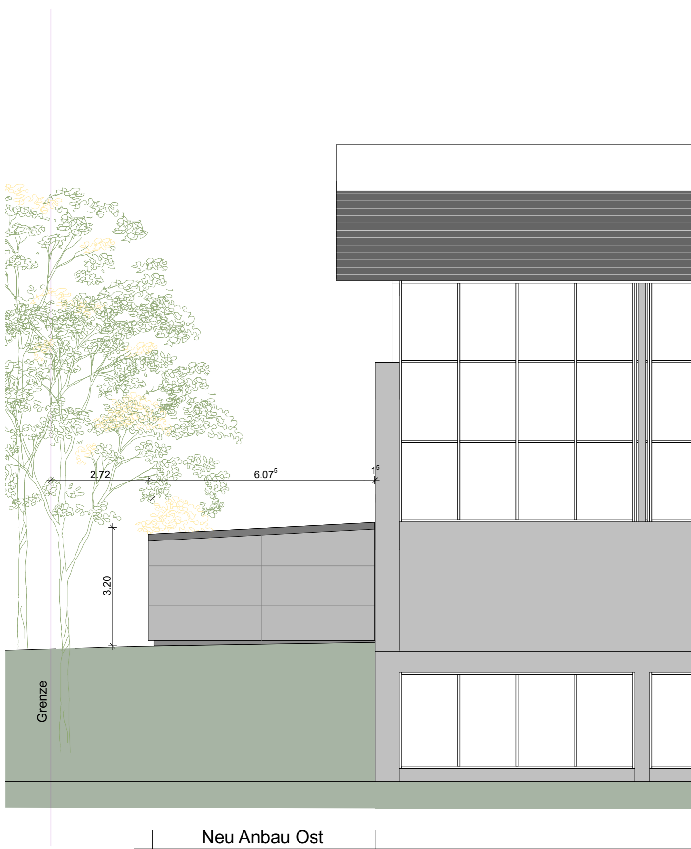
M 1-100 Ansicht Nord