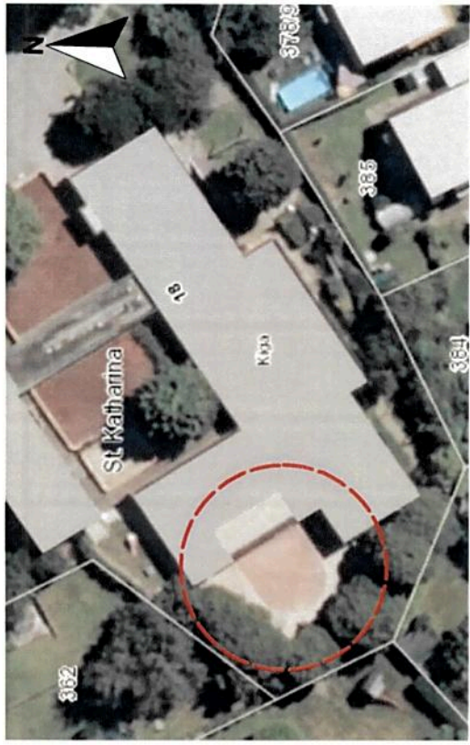
(Luftbild Quelle LUBW)